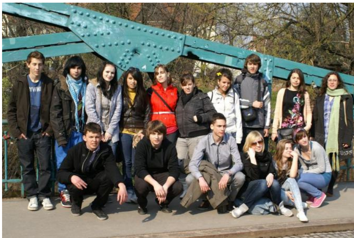
Les huit élèves de Tarragone avec leurs huit correspondants de Wrocław